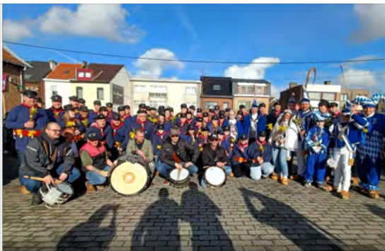
2026 - Halle - 1ste Soumonce Carnaval Halle 2026